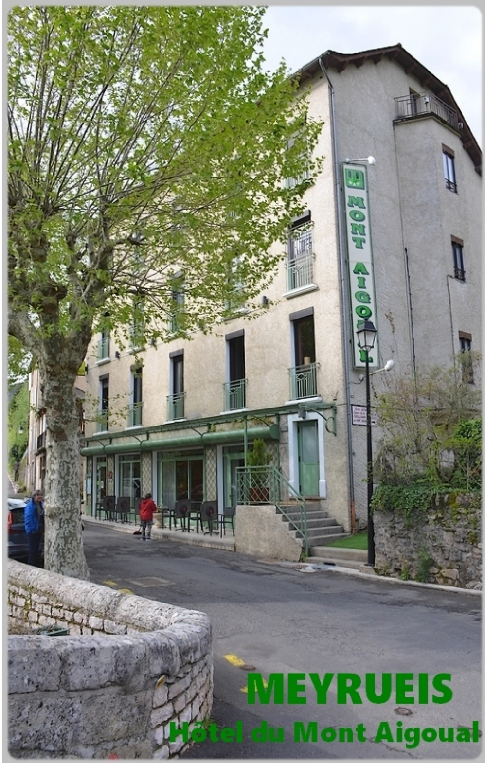
MEYRUEIS Hôtel du Mont Aigoual